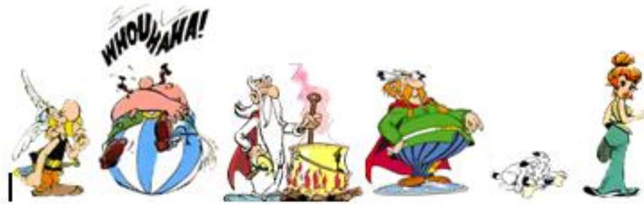
ASTERIX OBELIX PANDRAMX ABRARACOURCX IDEFIX MME AGECANONX

Le fil rouge du jour est assuré par Madame Contente et Monsieur Grincheux