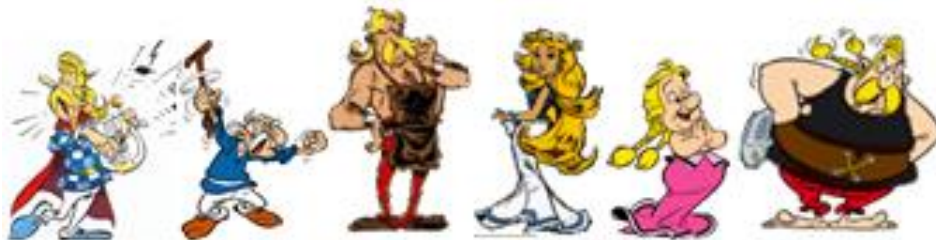
ASSURANCE TOURIX AGECANONX CETAUTOMATIX FALBALA BONEMINE ORDRALFABÉTIX

Astérix, le grand absent de ce magazine, n'est pas rentré de son expédition chez Cléopâtre.